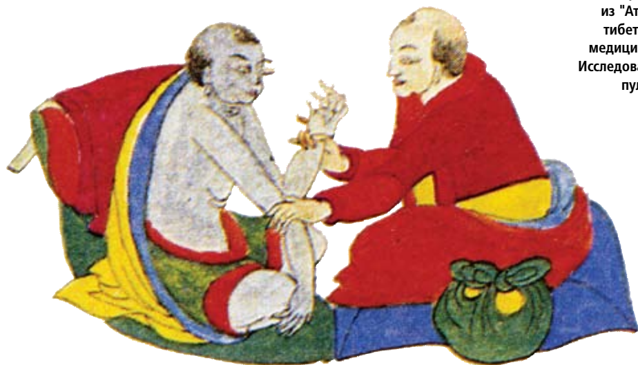
Иллюстрация из "Атласа тибетской медицины". Исследование пульса.

В этих поэтических строчках, преисполненных мудрости многих поколений врачей, три жизненных начала, три доши – Ветер (нервная система), Желчь (пищеварительная система), Слизь (лимфатическая и эндокринная системы) – названы близкими и главными причинами болезней. «Не бывает болезней, не вызванных доша», – гласит «Чжуд-Ши».