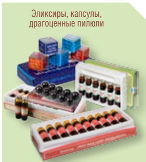
Эликсиры, капсулы, драгоценные пилюли