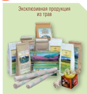
Эксклюзивная продукция из трав