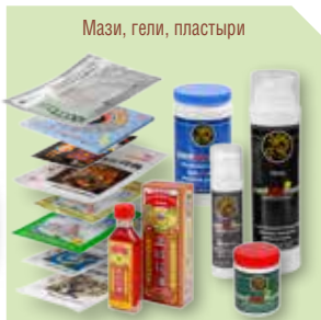
Мази, гели, пластыри