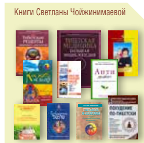
Книги Светланы Чойжинимаевой