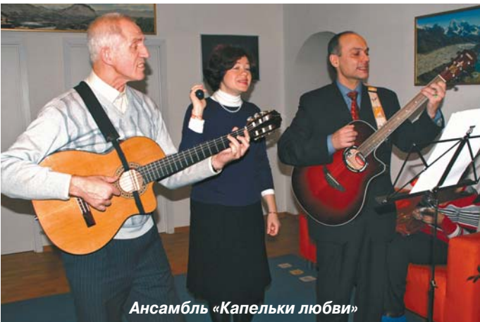
Ансамбль «Капельки любви»

Во время отбора финалистов произошло маленькое чудо. В конкурсе участвовал супруг одной из пациенток клиники с тяжелым диагнозом «рассеянный склероз» и занял второе место. Его жена нуждается в лечении каждые полгода, после двух курсов наступило значительное улучшение, но на третий курс они не пришли. Лечащий врач, узнав, что у па-