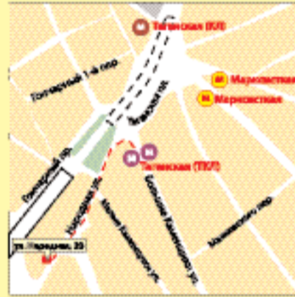
м. «Таганская», ул. Народная, 20