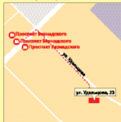
м. «Пр. Вернадского», ул. Удальцова, 23