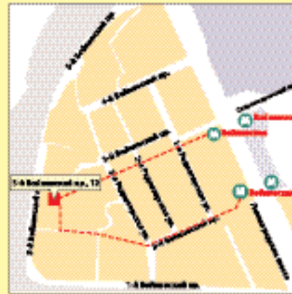
м. «Войковская», 5-й Войковский пр-д, 12