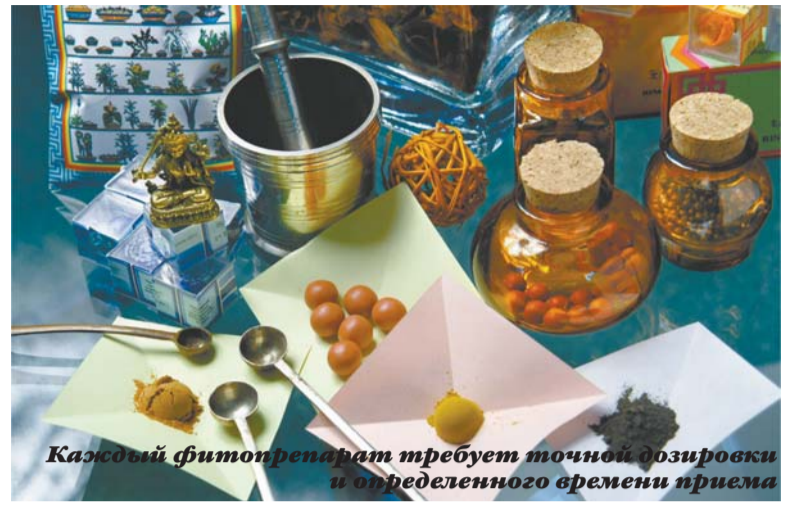
Каждый фитопрепарат требует точной дозировки и определенного времени приема

свойства лекарственных растений не абстрактно, а вполне реально. Так, считается, что в период новолуния растения обладают почти чудодейственной целебной силой, поэтому их нужно собирать в это время.