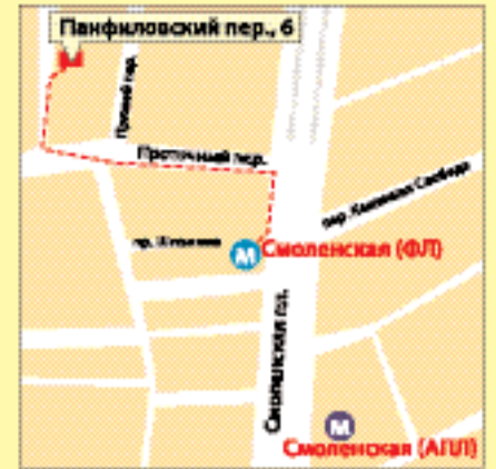
м. «Смоленская», Панфиловский пер., 6