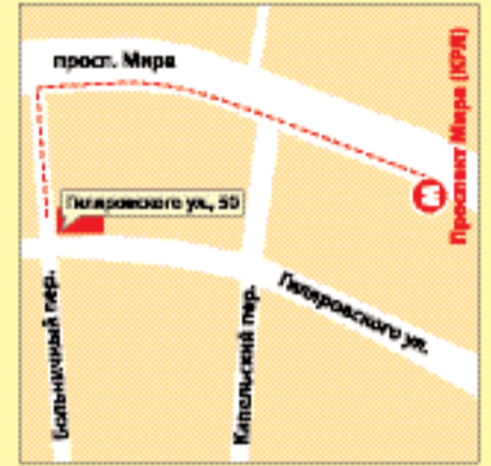
м. «Проспект Мира», ул. Гиляровского, 50