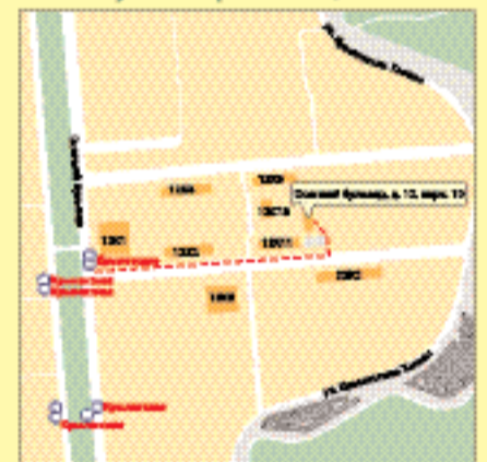
м. «Крылатское», ул. Осенний бульвар, д. 12, корп. 10

УВАЖАЕМЫЕ ЧИТАТЕЛИ! ПОДПИСКУ НА ГАЗЕТУ «ВЕСТНИК ТИБЕТСКОЙ МЕДИЦИНЫ» ВЫ МОЖЕТЕ ОФОРМИТЬ В ЛЮБОМ ПОЧТОВОМ ОТДЕЛЕНИИ РОССИИ. ПОДПИСНОЙ ИНДЕКС: 99683 ПОДПИСНАЯ ЦЕНА ПО МОСКВЕ 46,32 РУБ. — 3 МЕС. 92,64 РУБ. — 6 МЕС.